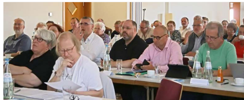
Synodale in Katzenfurt